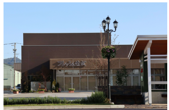
第11回景観広告とやま賞 景観広告大賞受賞作品 (高岡市)