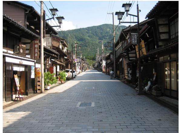
八日町町内会 (南砺市)

これらは県民共有の財産といえ、これを守り、育て、さらに魅力ある景観を創っていくため、平成14年9月に「富山県景観条例」を制定し、総合的な景観づくりに取り組んでいます。(平成15年4月1日施行)