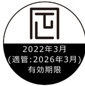
図 適管において使用する自動はかりの検定証印の様式