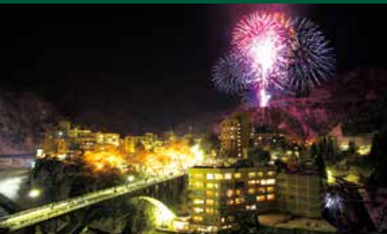
Pemandian Air Panas Unazuki