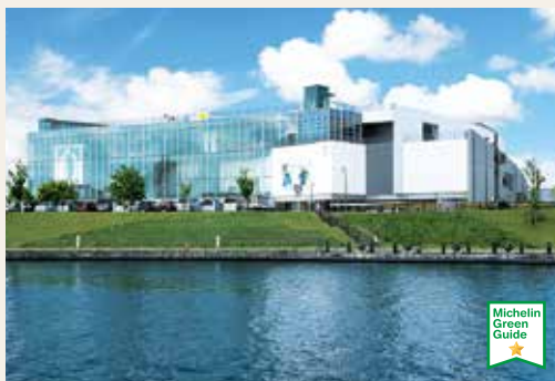
Museum Seni dan Desain Prefektur Toyama