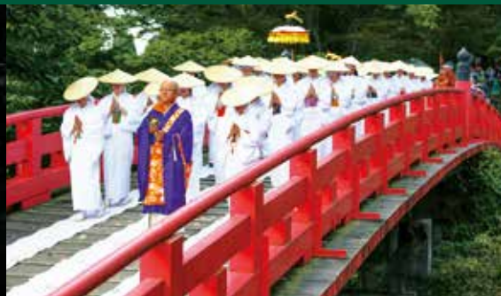
Upacara Nunobashi Kanjoe