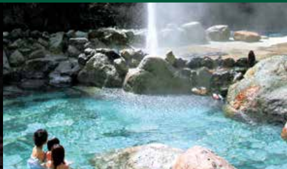
Pemandian Air Panas Kuronagi