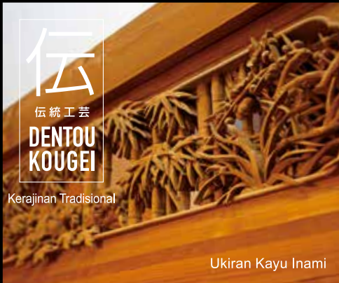
Ukiran Kayu Inami