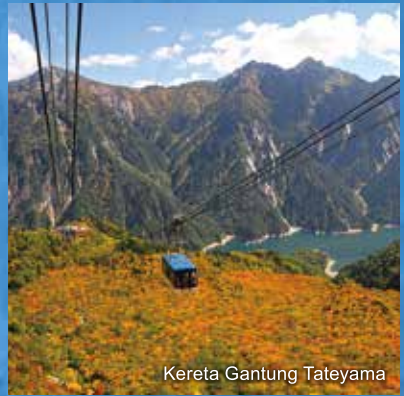
Kereta Gantung Tateyama