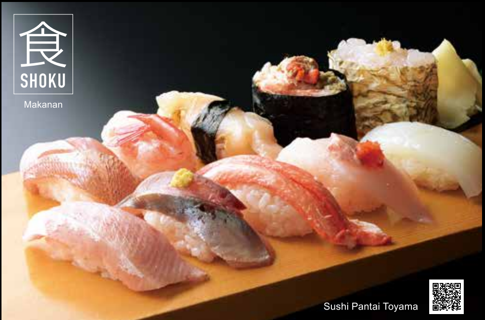
Sushi Pantai Toyama