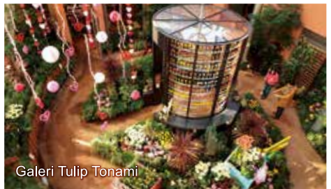
Galeri Tulip Tonami