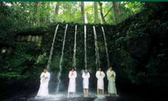
Pengalaman Meditasi Air Terjun di Kuil Oiwa Nissekiji