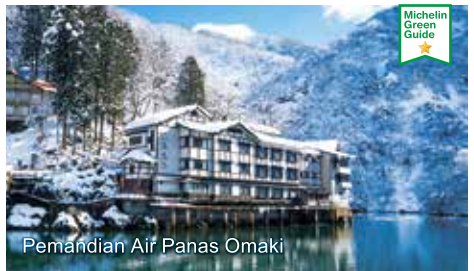
Pemandian Air Panas Omaki