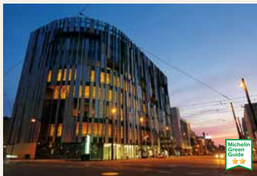
Museum Seni Kaca Toyama