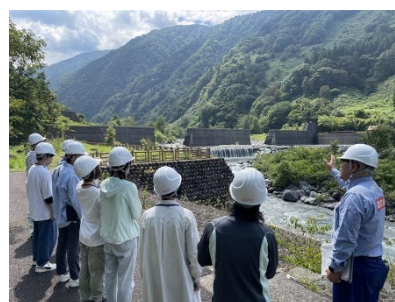
立山砂防世界遺産登録 推進コースプログラム

立山砂防の世界文化遺産登録に向けて、顕著な普遍的価値を国内外に広くアピールするため、立山砂防の文化的価値・意義を調査する。