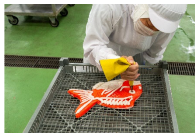
とやまの郷土食調査事業 (左：昆布 右：細工かまぼこ)