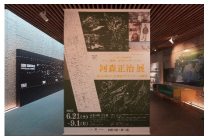
高志の国文学館企画展