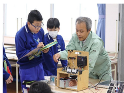
きらめきエンジニア事業 環境科学センター (南砺市立福野小学校)

県内の小学校・中学校・高等学校に、県立大学の教員や県立試験研究機関の研究員、企業等の研究者が出張し、特別講師として理工系の講義を実施することにより、児童・生徒の科学技術への関心を高め、創造的探究心を育てる。