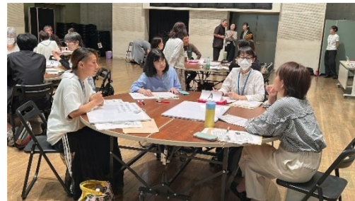
親学び講座の様子