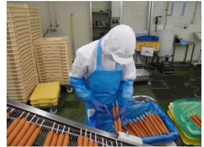
特別支援就労応援プロジェクト