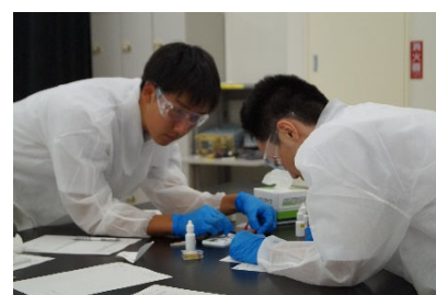
とやま科学オリンピック 2025 高校部門（化学分野）

科学に対する関心を高めるとともに、科学的才能を引き出して伸ばすことを目的に、中・高校生を対象に、数学・理科を中心とした思考力を問うとともに、実験・観察も取り入れた「とやま科学オリンピック」を開催する。