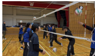
地域クラブ活動（魚津市）