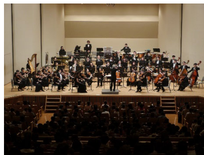
親子で楽しめるオーケストラコンサートの開催

県民に身近な場所で質の高い音楽鑑賞の機会を創出し、次世代を育成するため、親子で楽しむコンサート、青少年と若手演奏家とのコラボコンサートの開催や学校コンサート、室内楽フェスティバルへの支援を行う。