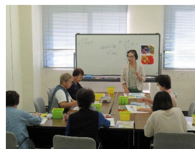
県民カレッジ講座の様子

ふるさと富山への愛着を深めて県内への人材定着へつなげるため、地域の魅力を発見することを中心とした学びの機会を提供する。