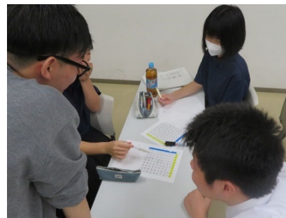
アカデミック・インターンシップ

・起業や新商品開発、高度な専門知識・技術の習得等のアントレプレナーシップの醸成や学科間連携の推進に資する実践的な体験活動等の取組を支援する。