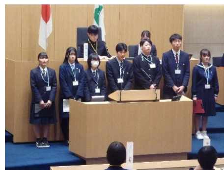
高校生とやま県議会

高校生の主権者教育の機会として、主体的な政治参加意識や地域社会へ参画する意識の向上を図るとともに、富山県のよりよい未来を創るため、県内高校生の代表が集まり、県政について学び、議会体験や意見交換を行う。