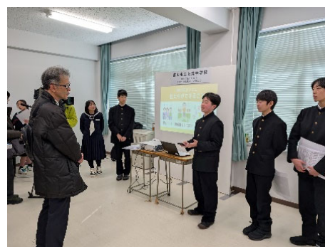
とやまこどもサミット

G7富山・金沢教育大臣会合「富山・金沢こどもサミット」で宣言された行動目標を実現するため、宣言にある取組みについて子どもたちが発信・共有する「とやまこどもサミット」を開催する。