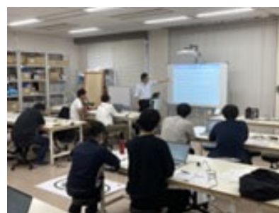
県立大学スキルアップ・リスキリング支援事業

企業の人材高度化に寄与するため、産業界のニーズを把握したうえで、最先端の知見や実習を取り入れた講座や、個別企業からの要望に応える講座を実施する。