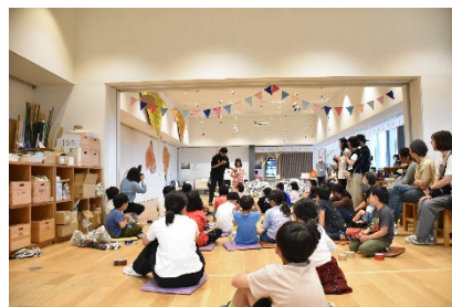
富山県美術館でのワークショップ

県美術館、水墨美術館、立山博物館、高志の国文学館において、子ども向けのワークショップなど教育普及活動を実施する。