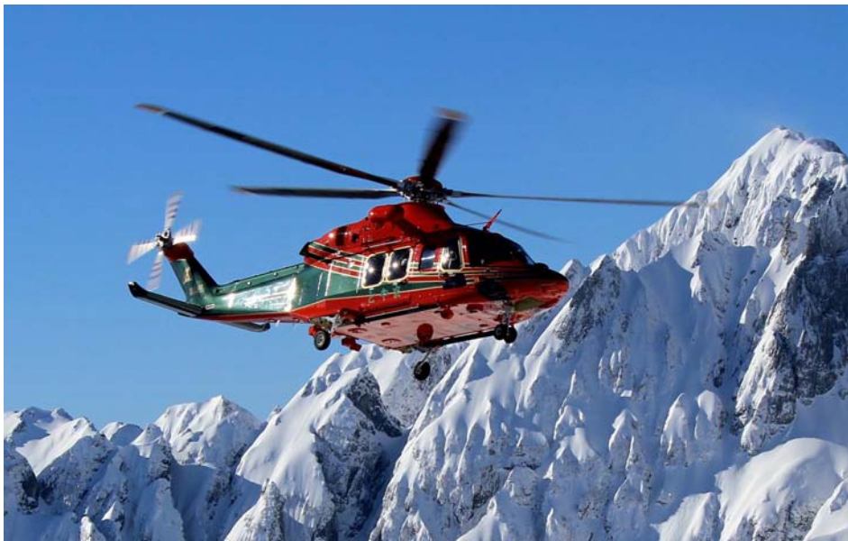
JA119W AW139 令和2年4月~