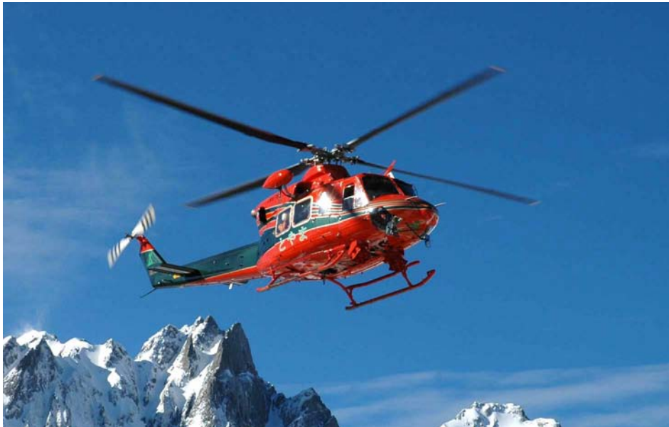
JA6768 Bell 412EP 平成8年4月~令和2年3月