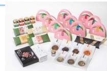
富のおもちかえり