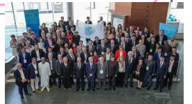
世界で最も美しい湾クラブ 世界総会in富山