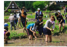
世界遺産(相倉集落)での田植え