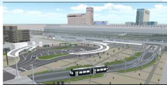
北口駅前広場の完成イメージ▶