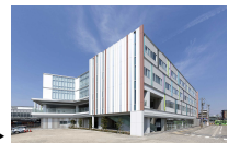
暮らし・にぎわい再生事業(高岡駅前東地区)▶