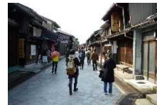
富山暮らし体験会