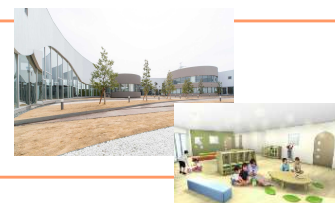
プレステージ・インターナショナル 大規模コールセンター「BPOタウン」(仕事と子育ての両立支援)