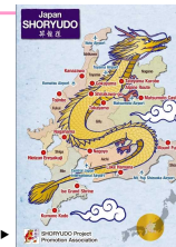
昇龍道プロジェクト