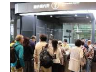
多言語に対応した観光案内所