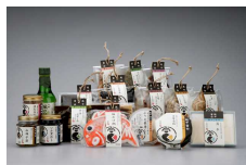
越中富山 幸のこわけ