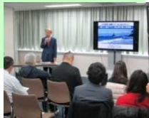
とやま移住・転職フェア