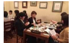
就活女子応援カフェ