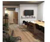
商店街の空き店舗を改装したシェアオフィス