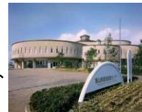
高岡テクノドーム