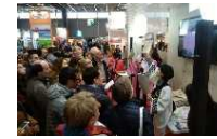
フランス旅行博でのPR