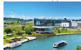
富岩運河環水公園・富山県美術館