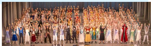
とやま世界子ども舞台芸術祭2016 オープニング公演「雪の女王」