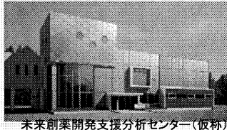
未来創業開発支援分析センター(仮称)