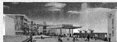
▲2019.4 開設予定の看護学部施設イメージ案