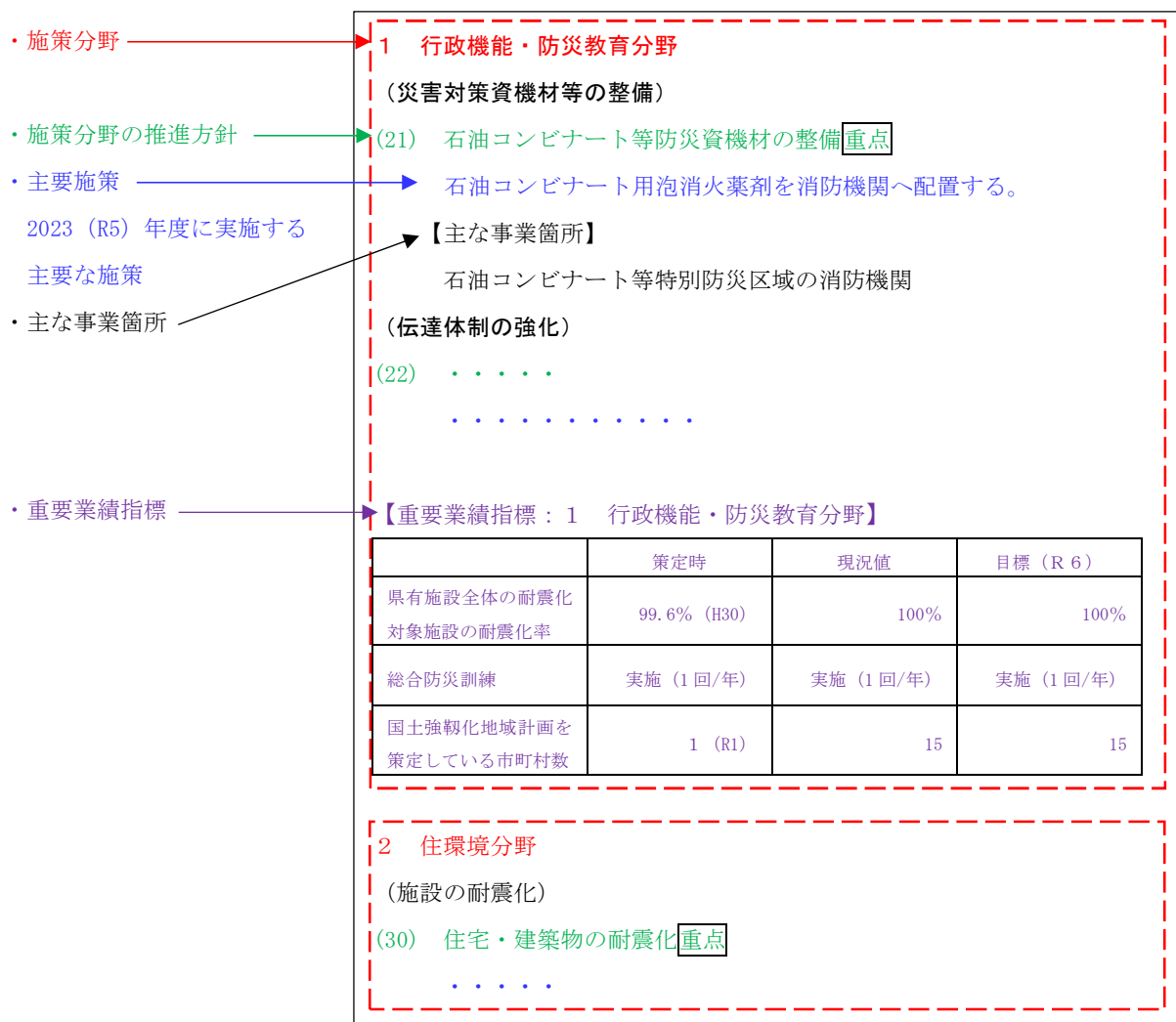
図2 アクションプラン構成イメージ