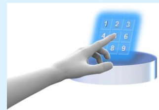
空中ディスプレイ