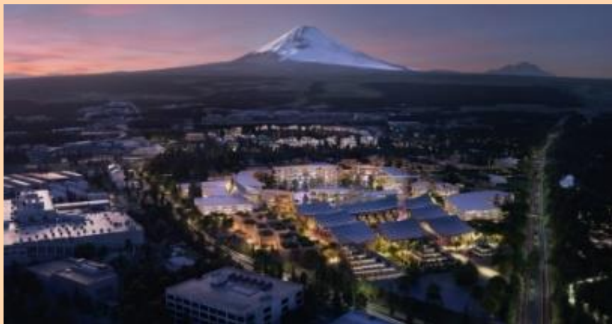
Woven City(ウーブン・シティ)

⇒ 公共交通機関の不備などで住宅に不向きな土地の価値がこのような先端技術によって高まる。