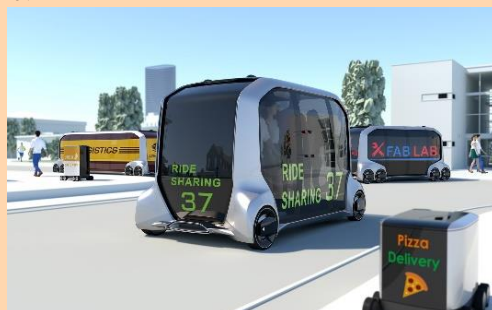
完全自動運転、排出ゼロの町

街の建物は主にカーボンニュートラルな木材で作られ、再生可能エネルギーを活用するなど環境との調和やサステナビリティを前提とした街