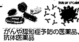
がんや認知症予防の医薬品、抗体医薬品