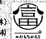
富のおもちかえり