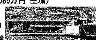
新近代美術館(仮称)(イメージ)