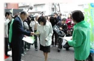
店頭でのマイバッグ持参呼びかけ

＜循環型社会・低炭素社会づくりの推進＞ レジ袋の削減を目指してコンビニで使用する小型マイバッグの配布やマイバッグ使用等を呼びかける普及啓発、レジ袋無料配布廃止、「とやまエコ・ストア制度」の普及拡大 等