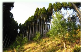
伐採跡地に植栽された優良無花粉スギ「立山 森の輝き」

＜水と緑の森づくり＞ スギ伐採跡地への優良無花粉スギ「立山 森の輝き」の植栽推進など県民参加の森づくりの推進