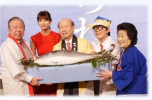
「富山のさかな」おもてなしフェア

＜水産業の振興と富山湾のさかなのブランド力向上＞ 「富山のさかな・水産加工品」のブランド力向上と販路拡大 等