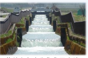
落差を有する農業用水路

＜再生可能エネルギーの導入、新たなエネルギーの利用に向けた開発の促進＞ 農業用水を利用した小水力発電施設の整備や導入支援、水素ステーションの県内整備 等