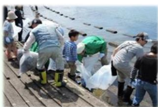
海岸清掃美化活動

＜清らかな水資源の保全と活用＞ 漂着物の削減に向けた上流から下流まで県民総ぐるみで取り組む河川等の清掃活動の実施 等