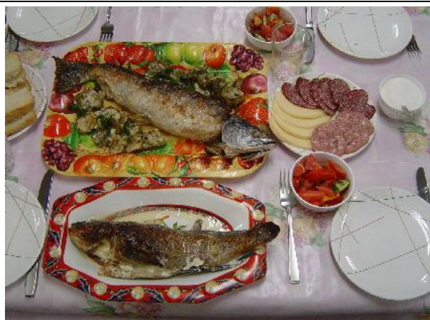
択捉島での家庭の食卓(歓迎の際出されたもの) オホーツク海で取れる身の詰まったカラフトマスや蟹 など魚介類中心の食卓が多い。