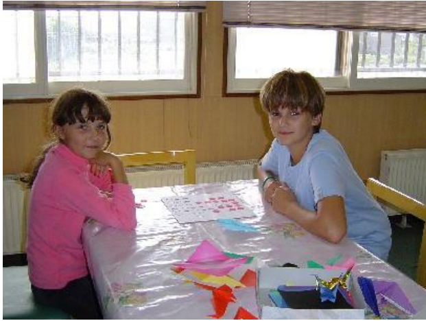
折り紙で遊ぶ子供たち(国後島) 日本文化に対する関心は高く、日本語を学ぶ子供たちも多い。