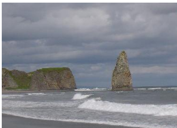
ろうそく岩(国 後島) ろうそくの形をした、奇異な形で見学者も多い岩