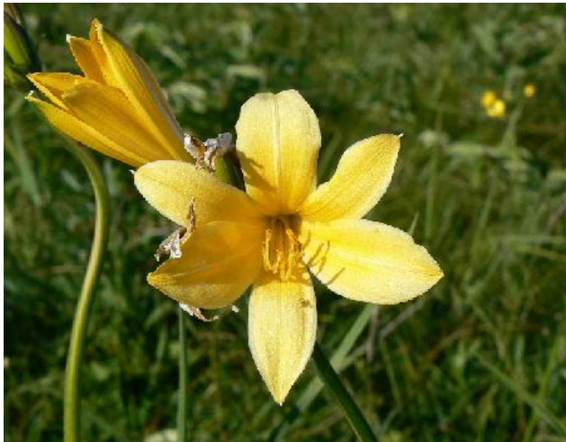
エゾカンゾウ(ニッコウキスゲの一種)。夏には島の草原いっばいに美しく咲き乱れる。