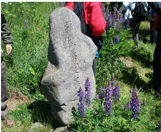
日本人墓地(択捉島)