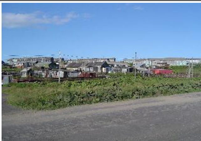
住宅街の様子 (H16 国後島)