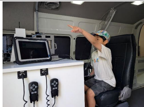
測定車にのってみよう