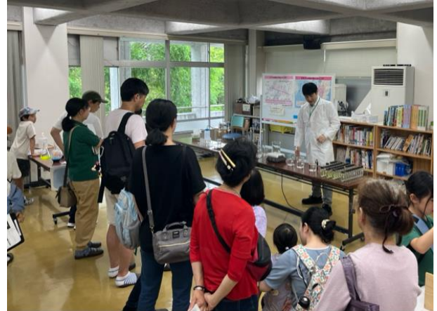
カラフル科学実験ショー