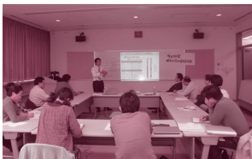
平成23年度実施事業より