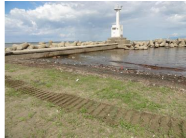
清掃活動後の海岸