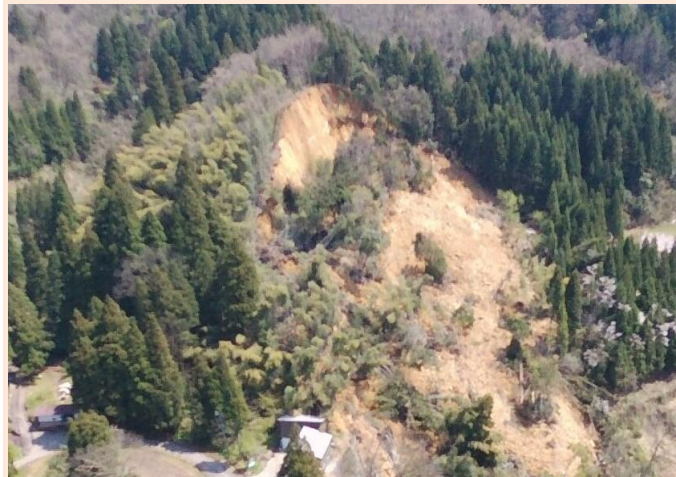
令和2年4月2日に発生した地すべり(虫谷地区) (立山町虫谷津割ほか地内)