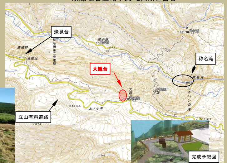
大観台園地の整備 (歩道、園地等の整備)