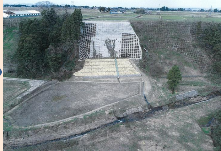
令和3年度(繰越)予防治山事業 山腹工(R4完成)