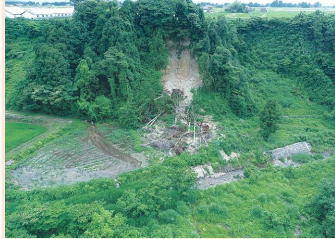
令和2年12月に発生した山腹崩壊 (立山町芦見水尻ほか地内)