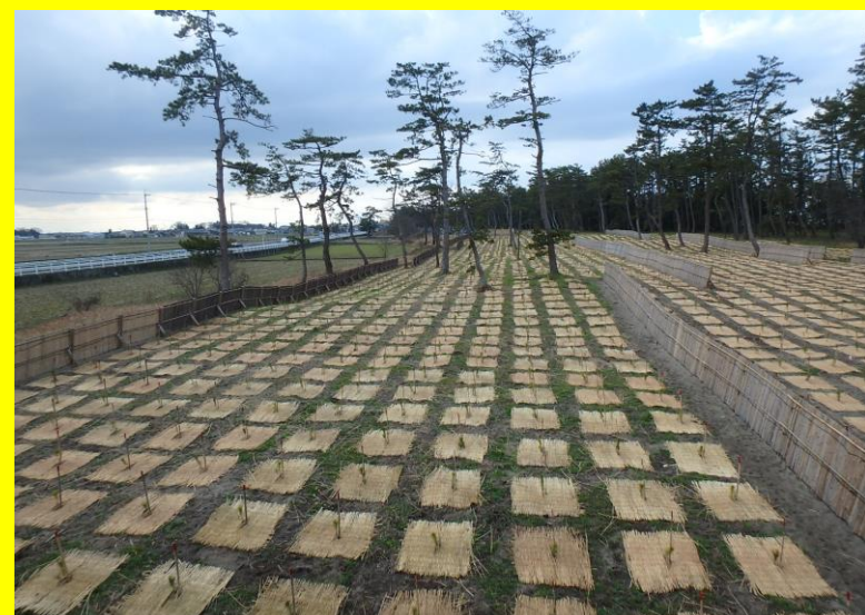
衰退した海岸の松林を復旧するため、抵抗性クロマツの 苗木を植栽(富山市日方江)