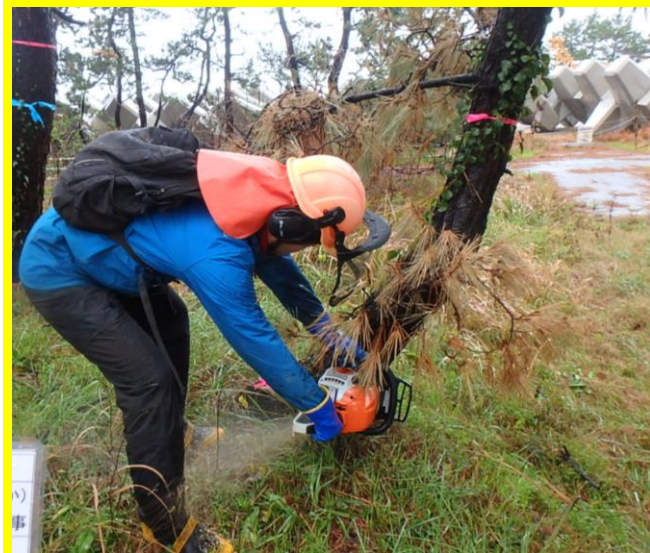
被害木を伐倒・搬出することで、マツクイムシ被害の 拡大を防止(富山市海岸通りほか)