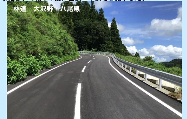
林道 大沢野・八尾線