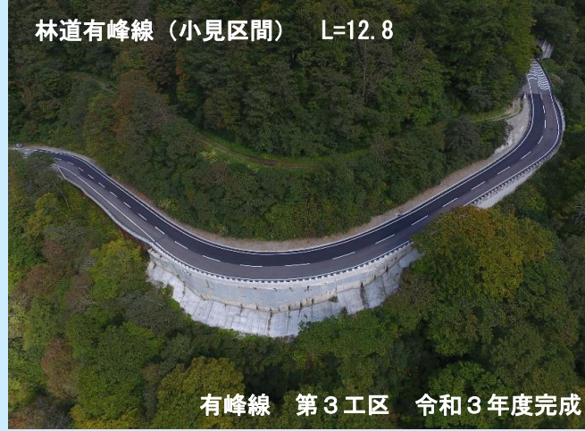
林道有峰線(小見区間) L=12.8