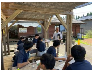
農業高校生に対する 就農体験会