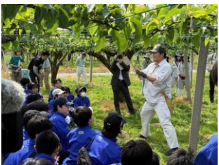
中学生に対する梨の摘果 作業体験学習会