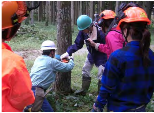
「森づくり塾」では機械の操作実習や安全講習などを実施しました。