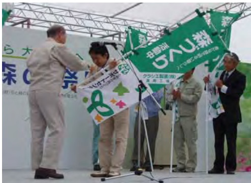
多くの県民が参加する森の祭典（砺波市）において、のぼり旗の贈呈を行いました。