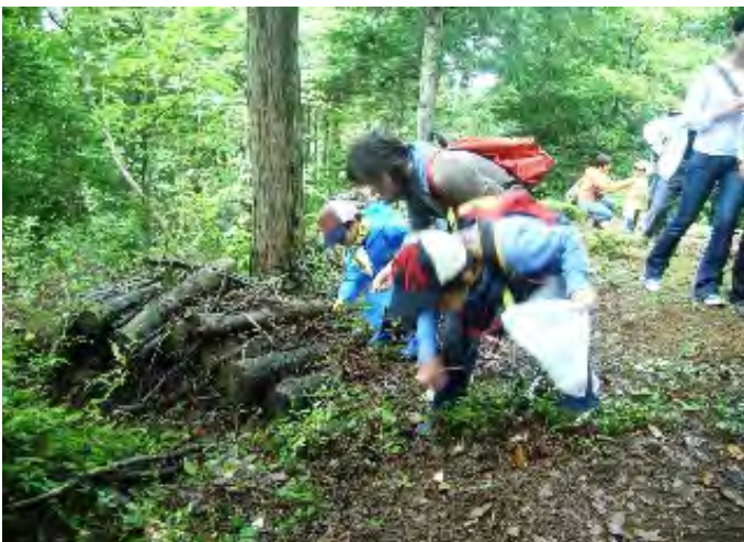
10月11日、時折小雨の降る中、フォレストリーダーの引率のもと、頼成の森の遊歩道を散策しながらコナラなどのドングリを拾いました。