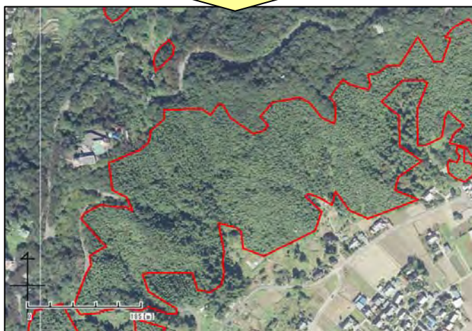
平成16年の分布（約1.7倍に拡大）