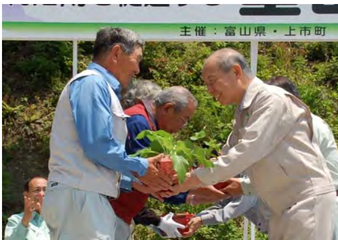
第1回目（5/18）を「里山の集い」として開催し、石井知事はじめ地域住民の皆さんが利活用体験に汗を流しました。（山菜苗の贈呈）

実施場所 上市町黒川地区 取組内容 県下各地の里山地区の住民などが参加し、広葉樹林の除伐、炭焼材料集め、キノコ植菌、山菜の植付け、炭焼きなど里山の活用方法を体験。 ・参加者数 5月18日 271名、10月25日 51名、11月8日 74名 事業主体 県