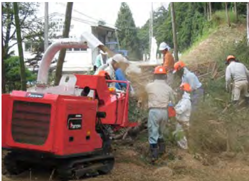
伐採木竹を処理するチップパーを貸し出しています。