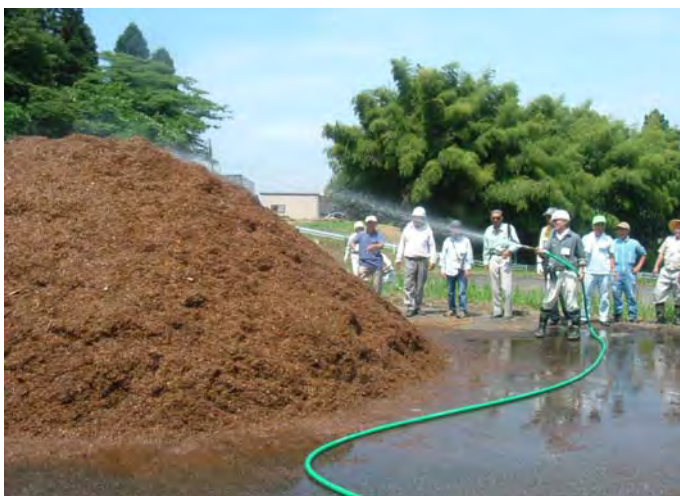
竹林整備で発生した竹をチップ化し、発酵促進剤を混ぜて堆肥化に取り組んでいます。 (きんたろう倶楽部)