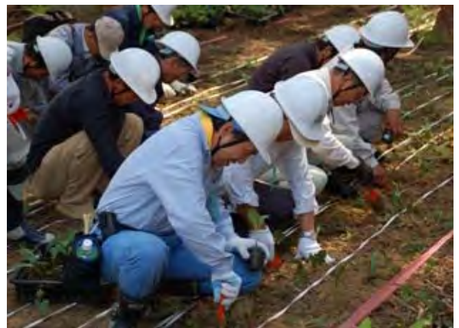
森林整備の実施により、明るくなった里山林へギョウジャニンニクなど山菜苗の植付けを体験しました。