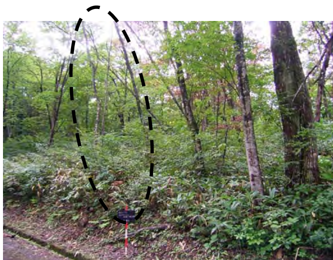
枯損木を除去し、未然に危険を回避しました。