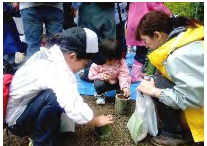
拾ってきたドングリを竹で作った鉢などに鉢植えしました。参加者は家に持ち帰り、ドングリの「里親」となって苗を育てていただきます。