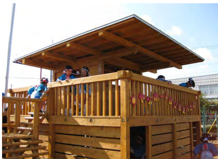
子どものデザインにもとづき木製遊具を幼稚園に設置しました。

県内の各種イベント等へ貸し出しを行っています。 (県・市町村・民間企業等の団体で利用可能)