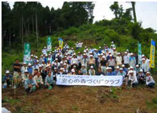
森林所有者との協定の締結など、ボランティア団体や企業の森づくり活動を積極的に支援しました。