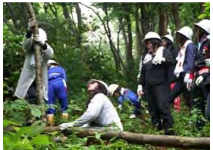
親子で地域の里山林整備に取り組み、親子の絆、地域の森との絆を深めています。 (氷見市立十三中学校育友会)