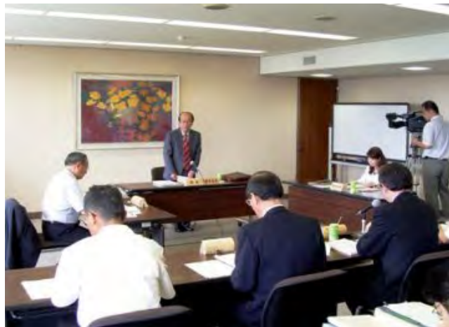
森林審議会森づくり部会により19年度事業の 評価をしていただきました。