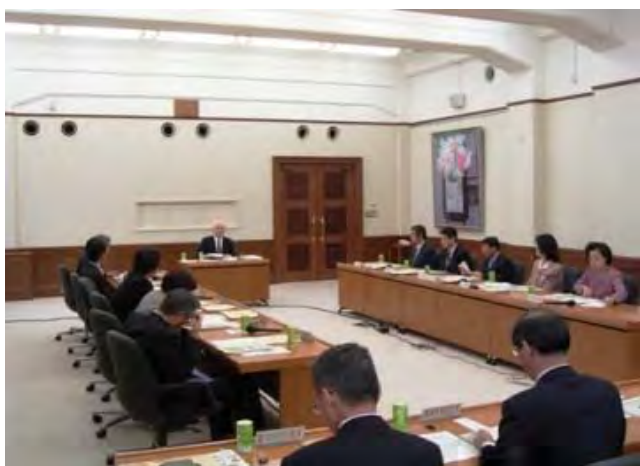
平成20年度 第1回 富山県水と緑の森づくり会議