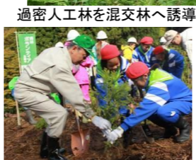
「立山 森の輝き」の植栽