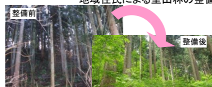
過密人工林を混交林へ誘導

風雪被害林や過密人工林、竹林が侵入した人工林を整備し、混交林に誘導(113ha) 森づくり事業や全国植樹祭で使用する県産広葉樹苗を県民協働で育成