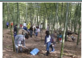
地域住民による里山林の整備

県民協働による、里山林の整備(282ha,27地区)を推進 里山林の継続的な管理・利用を推進するため、里山地区のリーダーを養成 カシノナガキクイムシ等の森林病虫害などによる枯損木を除去