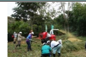
サポートセンターによる森づくり用機器の貸出し

森林ボランティア活動を専門的・総合的に支援 森づくり活動機器(ヘルメット、ノコギリ、チップパー機など)の貸出や保険料を支援 森林ボランティアの施業技術の習得・向上等のため森づくり塾を開催(30回)