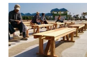
全国植樹祭等で使用する県産材ベンチ