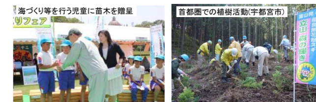
県内外で「立山 森の輝き」を普及PR