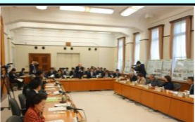
水と緑の森づくり会議の開催