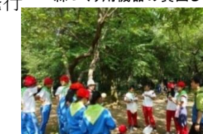
森の寺子屋の開催

森づくりへの理解を深めるため「森の寺子屋」を開催(120回) フォレストリーダーの指導力向上のための研修を実施