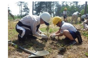
県民の提案による森づくり活動