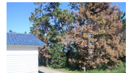
松くい虫による被害状況

森林資源の循環利用と花粉症対策の一環として、本県で開発した優良無花粉スギ「立山 森の輝き」の普及を推進