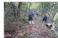
地域住民による里山林の整備