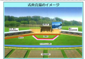
式典会場のイメージ