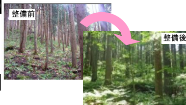
過密人工林を混交林へ誘導