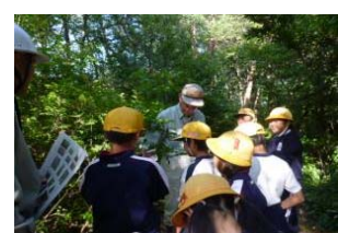
森の寺子屋の開催