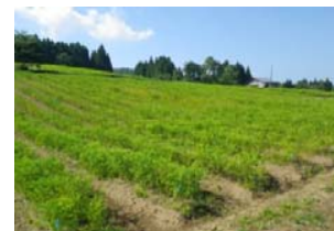
「立山 森の輝き」の生産