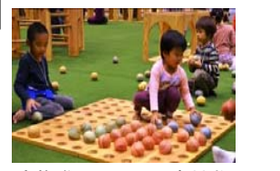
木育推進のための県産材遊具