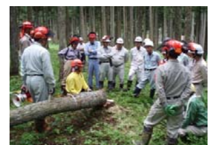
森づくり塾の開催