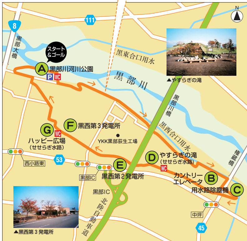
黒部川左岸土地改良区 / 〒938-0031 黒部市三日市1355-1 tel 0765-52-0262 fax 0765-54-4838