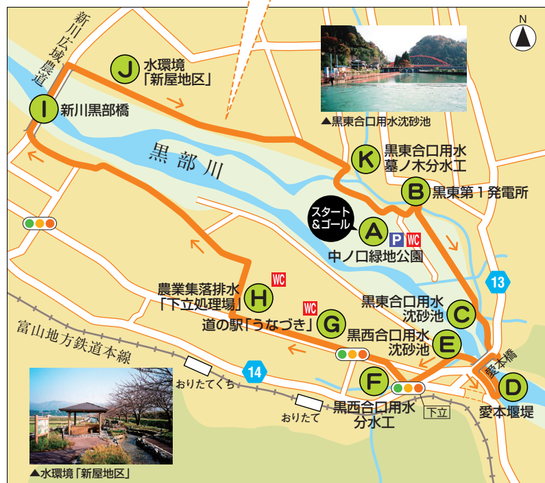
黒部川左岸土地改良区 / 〒938-0031 黒部市三日市1355-1 tel 0765-52-0262 fax 0765-54-4838 入善土地改良区 / 〒939-0642 入善町上野777-1 tel 0765-72-2221 fax 0765-72-1027