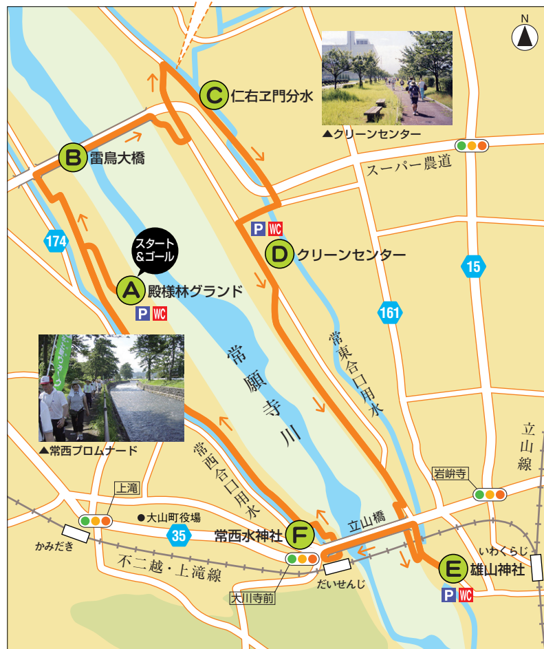
問 常西用水土地改良区 / 〒930-0006 富山市新総曲輪2-21 tel 076-445-2350 fax 076-445-2347 常東用水土地改良区 / 〒930-1368 立山町岩崎寺281 tel 076-483-1651 fax 076-483-1667