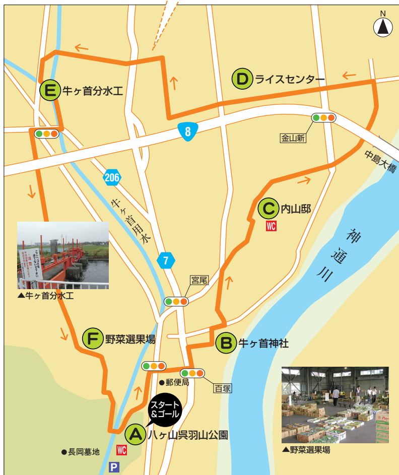
問 牛ヶ首用水土地改良区 / 〒930-0107 富山市大塚東32 tel 076-427-2722 fax 076-434-0409