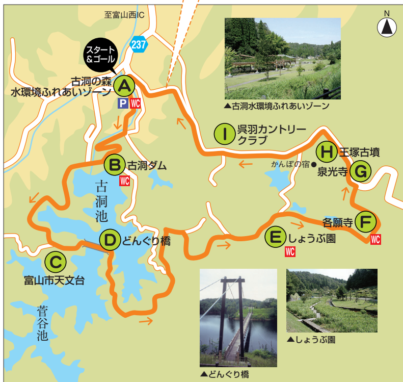
〔間〕 呉羽射水山ろく用水土地改良区 / 〒930-0165 富山市西押川1571-2 tel 076-434-3366 fax 076-434-3342