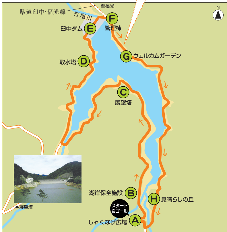
〔間〕 小矢部川上流用水土地改良区 / 〒939-1732 南砺市荒木1550 tel 0763-52-0849 fax 0763-52-4044