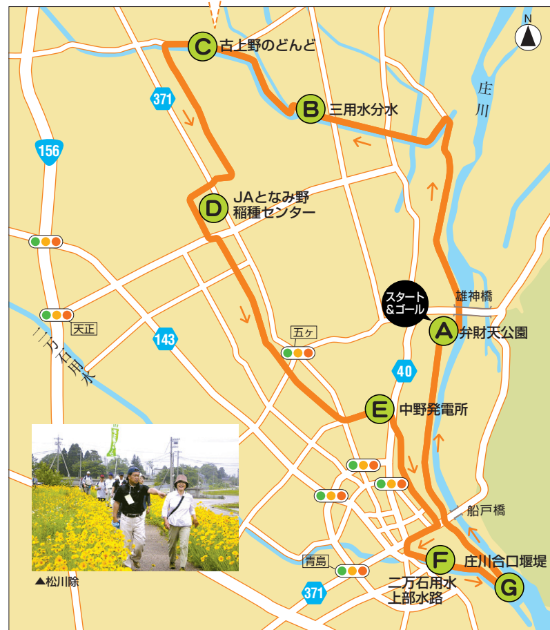
問 庄川沿岸用水連合 / 〒939-1386 砺波市幸町1-8 tel 0763-32-2351 fax 0763-32-7009