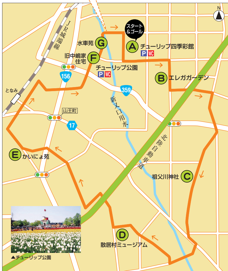
問 庄西用水土地改良区 / 〒939-1386 砺波市幸町1-8 tel 0763-32-3316 fax 0763-32-7009