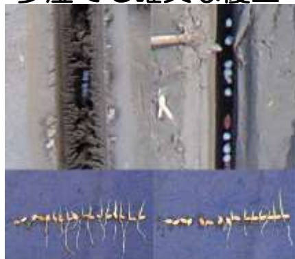
かき棒型覆土装置 分銅型覆土装置 図2 覆土装置による播種後の覆土状態と出芽状況の比較(2015)