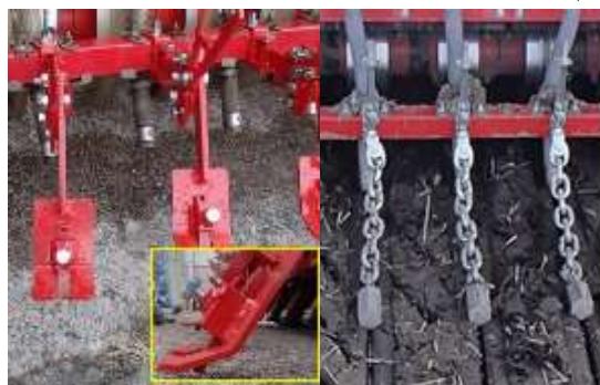
図1 かき棒型覆土装置（左）と分銅型覆土装置（右）