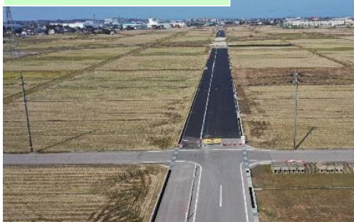
市道水橋伊勢屋肘崎線舗装(第2工区)工事…⑧