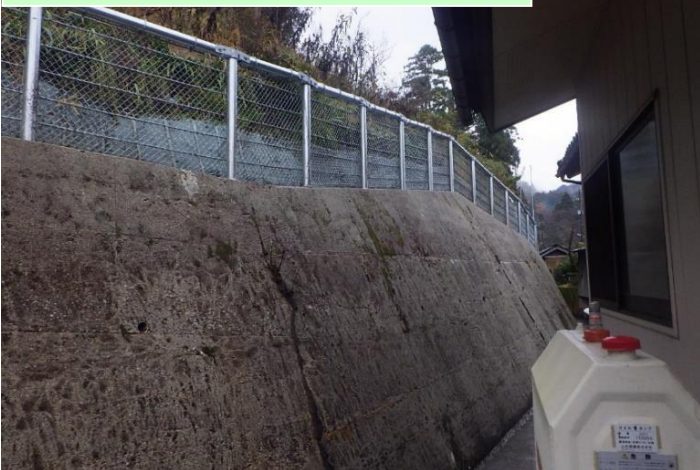
大松地区県単独砂防維持修繕防護柵工事…③