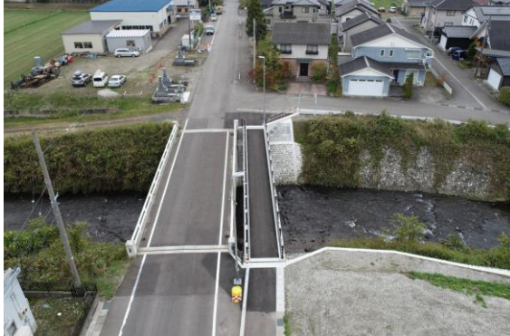
町道日中田添線歩道橋上部工工事…⑤