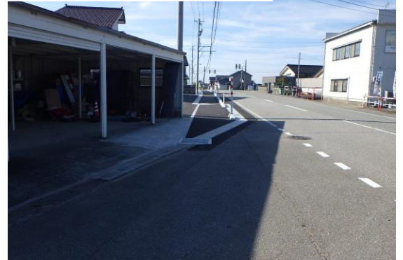
町道坂井沢白岩線道路改良その1工事…⑥