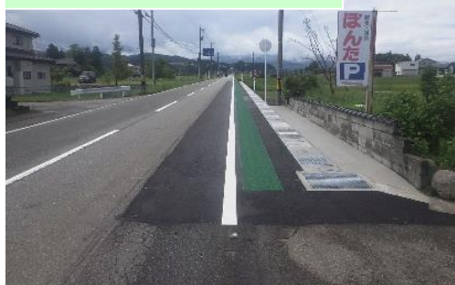
主要地方道富山立山公園線県単独道路改良 (フレッシュアップ)路肩拡幅工事…⑩