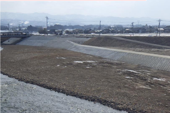
白岩川河川総合交付金(上市工区)護岸工第1工区工事…①