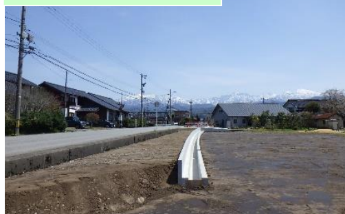
町道和合・栢沢線改良その1工事 (和合地区)…⑦