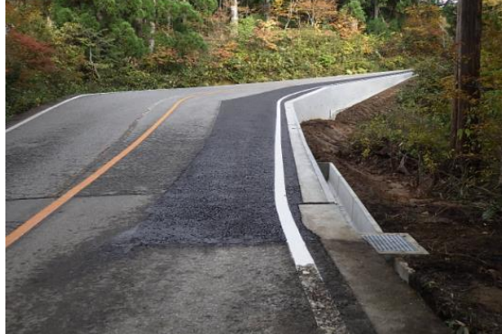
主要地方道富山立山公園線県単独道路改良工事…④