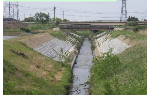
白岩川水系石割川県単独河川維持修繕 護岸工工事…⑨