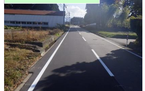
一般県道岩嶺寺大石原水橋線県単独道路維 持修繕舗装補修その1工事…⑫