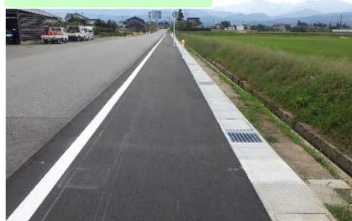
町道若杉新・放士ヶ瀬線改良工事…⑪