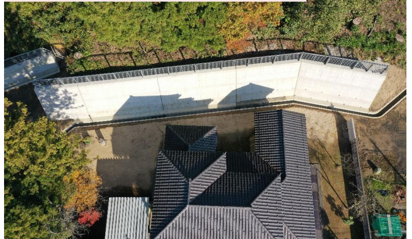
栢津地区砂防総合交付金(急傾斜)擁壁工その2工事…②