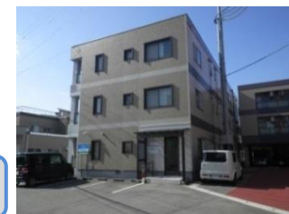
訪問介護 ステーション