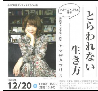
サンフォルテみらい塾