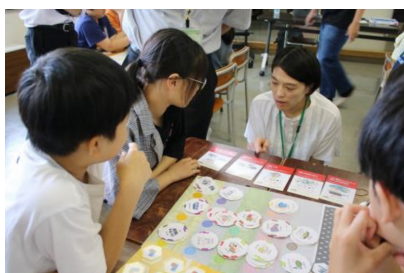
公開モデル授業の様子

また、希望する学校・企業等に学習ゲームを貸し出すとともに、学習ゲームのファシリテータの養成や、市職員による学習ゲームを活用した出前講座を実施した。