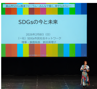
専門家による講演