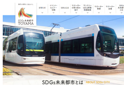
専用ウェブサイト