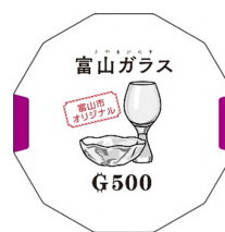
富山市版 SDGs 学習ゲームのカード