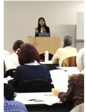
DV等防止啓発セミナー