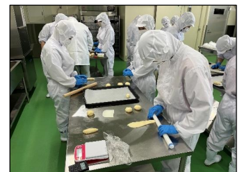
小麦農林10号を用いたパン製造