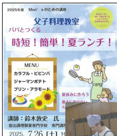
パパとつくる 時短！簡単！夏ランチ！