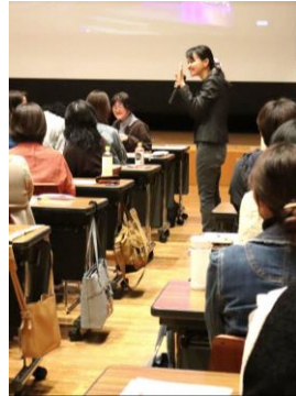
こころ&からだセミナー