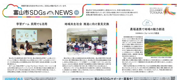
新聞での取り組み事例紹介

北日本新聞の朝刊や専用ウェブサイトを活用し、富山市の取組みや市内の企業・団体等の取組事例について紹介するとともに、「富山市SDGsサポーター登録制度」の周知を行った。