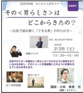
わくわく人生セミナー