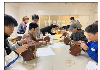
古材から作品を製作