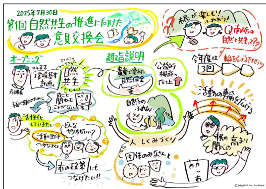
グラフィックファシリテーション