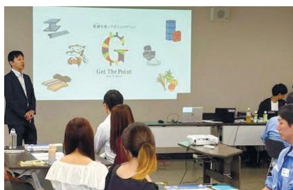
民間企業での活用