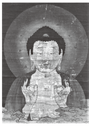
山越阿弥陀図(部分、光照寺蔵)