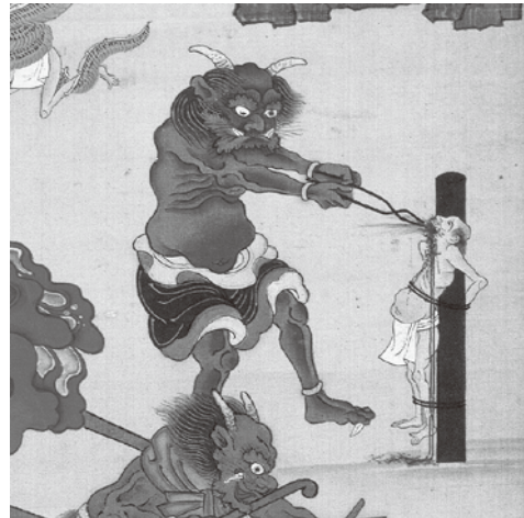
立山曼荼羅大仙坊A本 大叫喚地獄の場面(部分、芦峯寺大仙坊蔵)