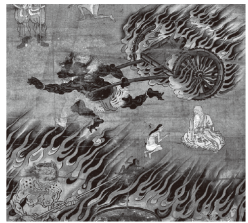
地藏十王図 伝都市王幅(部分、大楽寺蔵)