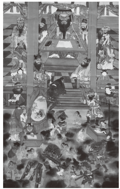
六道絵通坊本 閻魔王宮幅(部分、正興寺(通坊)蔵)