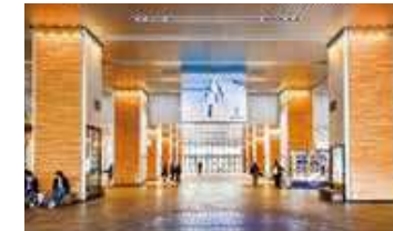
南口から見た(手前から)B、A