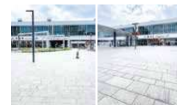
F 軌道西側 G 軌道東側