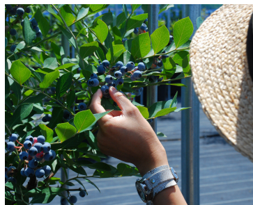
摘み取り体験サービス (観光農園)