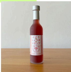
自家農産物の加工品 (OEM含む)