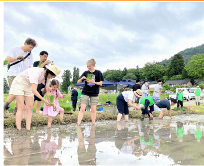
農業体験サービス