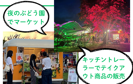
夜のぶどう園 でマーケット