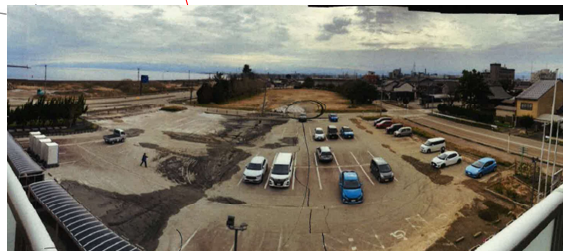
液状化被害（高岡市）