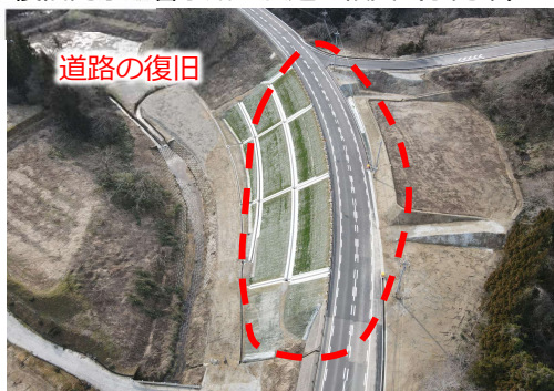
崩落した国道359号（小矢部市）