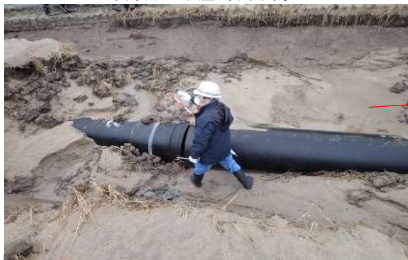
本復旧完了る管水路・農道の被災（氷見市）