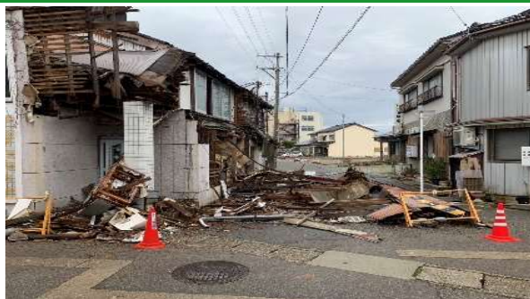
倒壊した家屋（氷見市）