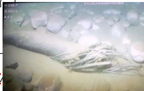
海洋深層水取水管断絶（入善町）