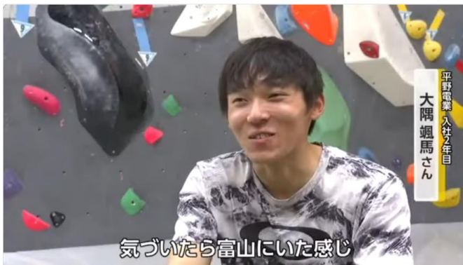
出典:富山テレビ(2025年11月4日) 他に、NHK WORLD(2025年11月8日)や LBS(日本経済新聞社とテレビ東京系列の 5つのローカル局でも2025年3月10日報道)