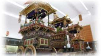
八尾曳山展示館（無料）