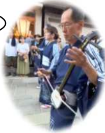
風の盆 胡弓の生演奏あり♪