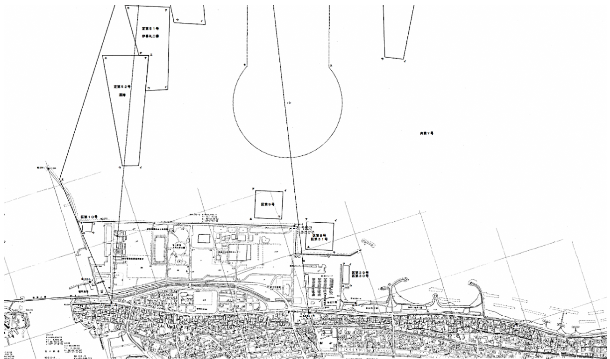
区第29号、区第30号及び区第31号