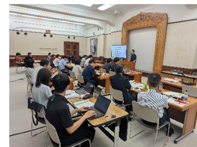
とやま伝統産業プロデューサー 人材育成プログラム