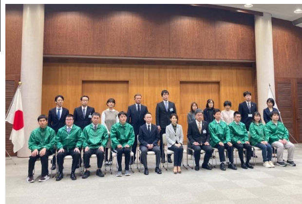
アビリンピック選手団激励会