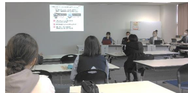
女性の多様な働き方支援事業