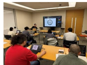
デジタルものづくりラボ