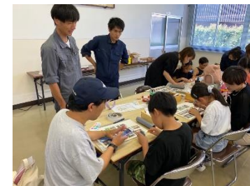
夏休みものづくり体験