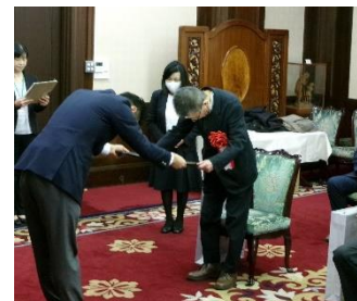
職業能力開発優良企業表彰