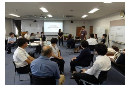
とやま中小企業人材育成カレッジ