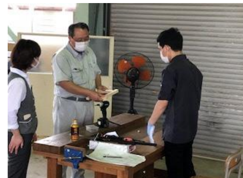
技能実習生講習(金属プレス)