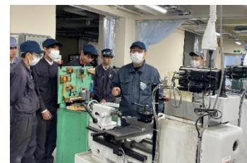
高校生に対する技能出前講座