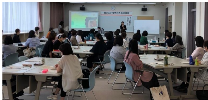
女性のキャリアデザイン応援事業