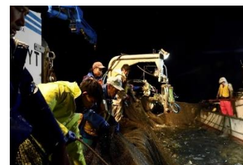
漁業担い手確保育成対策事業