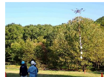
大型ドローン操作技能習得