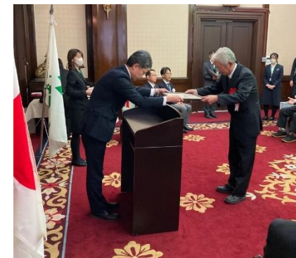
「とやまの名匠」認定式