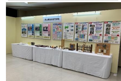
ポリテックビジョンへの出展