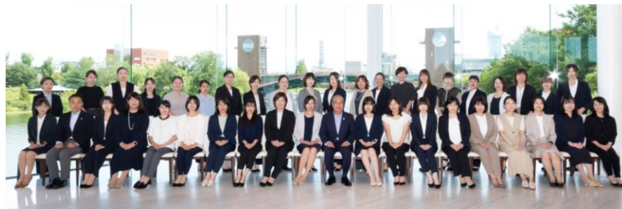
煌めく女性ネットワーク事業