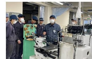
高校生に対する技能出前講座