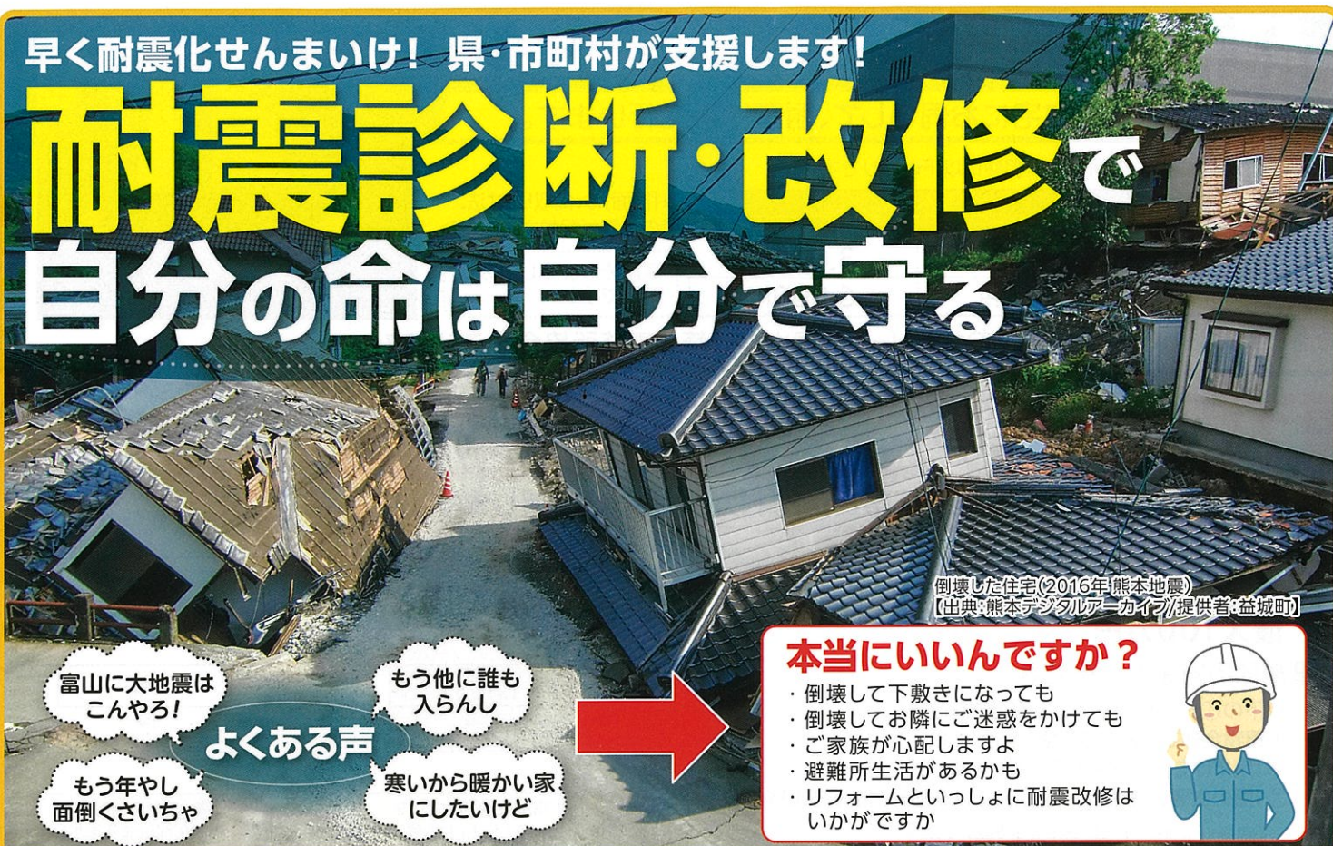
倒壊した住宅(2016年熊本地震)