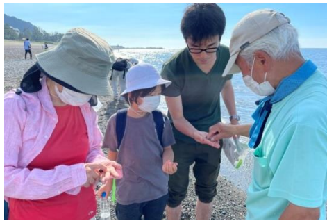
地域の魅力を発掘（海岸でヒスイ探し）