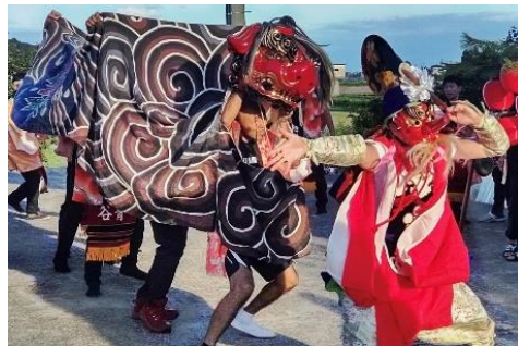
農村地域での伝統芸能風景（獅子舞）