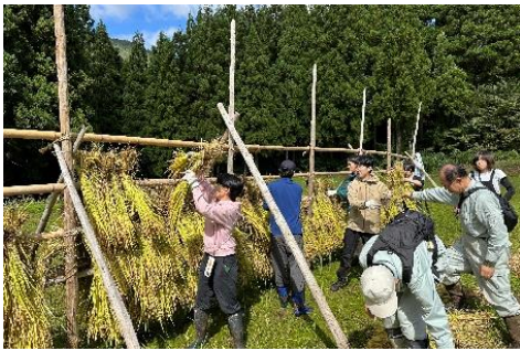
農作業体験イベントの企画・運営