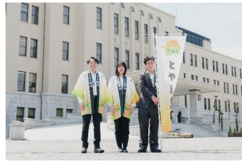
こんな仲間と働きます