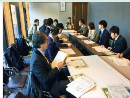
大阪市からの取り組み状況説明