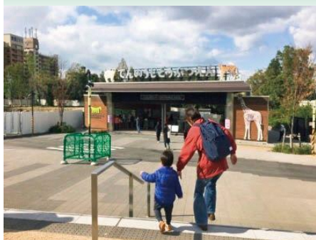
天王寺動物園 リニューアルにより入園者は約2.8倍