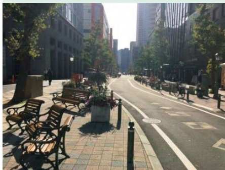
車線を減らし、新たに生み出した空間を 人優先に再配分