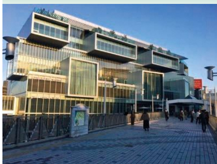
大型商業施設 T-site TSUTAYA運営会社による商業施設

「再整備ひらかた人が主役のゆとりと賑わいのまちへ」を基本コンセプトに再整備を実施中。