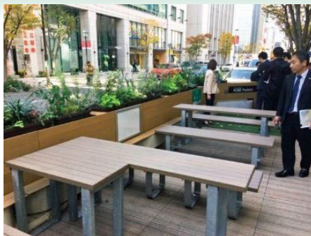
KOBEパークレット 街中に休憩スペースを設置