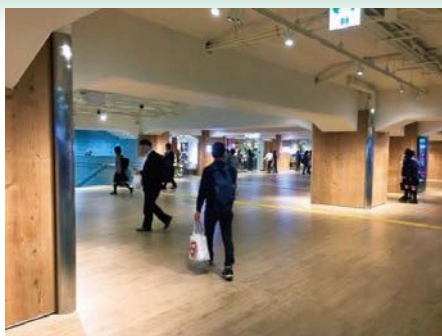
枚方市駅の改札リニューアル 良品計画(株)によるデザイン