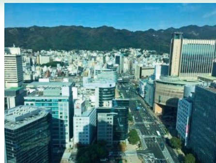
三ノ宮駅周辺 新たなバスターミナルを整備予定