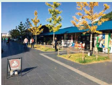
新たな賑わいを創出する飲食・物販施設