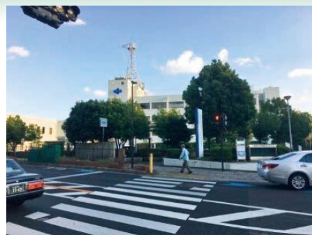
行政機能の再整備による 公的不動産の最適利用を検討中