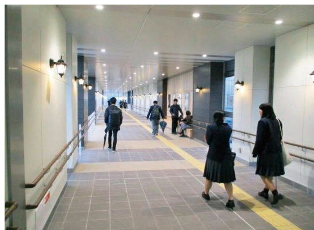
南北自由通路の内観