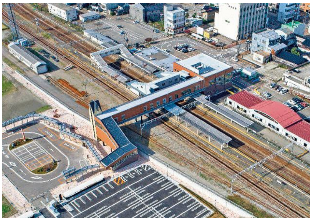
南北自由通路の外観（航空写真）