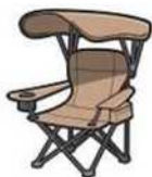
シェード付きチェア