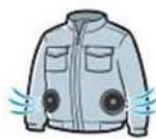
ファン付きウェア