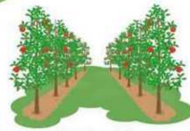
省力樹形への転換