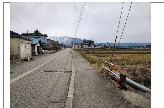
②町道西裏線用水路