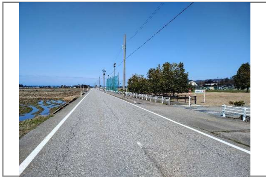
①IF2号用水路及びIF3号用水路