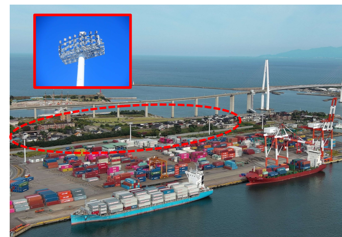
ヤード内の L E D 照明