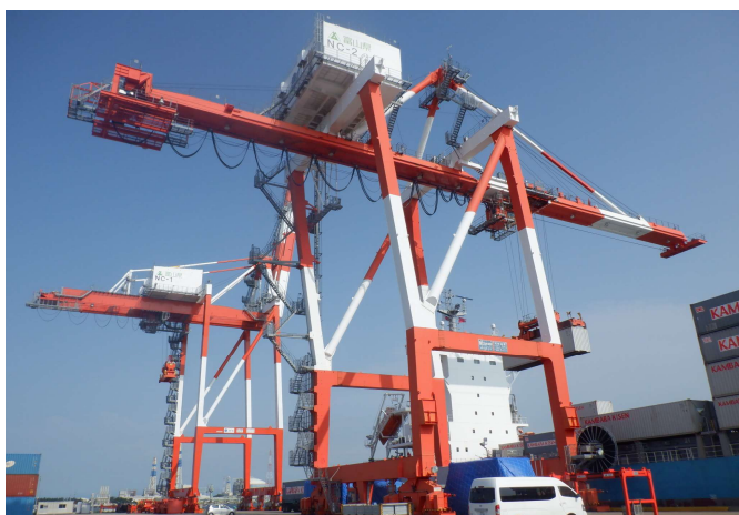
インバータ制御方式のガントリークレーン

コンテナ船1,000TEU級の2隻同時接岸が可能であり、対岸諸国との外貿定期コンテナ航路、国際フィーダー航路が就航しており、ものづくり県を支える環日本海物流拠点として、さらなる機能強化や利用促進、脱炭素化を図ります。