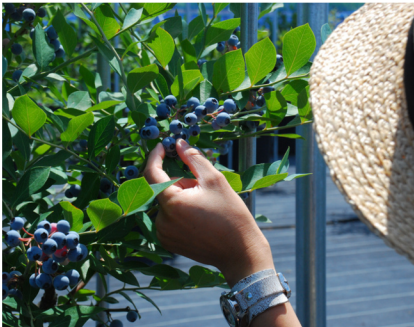
摘み取り体験サービス（観光農園）