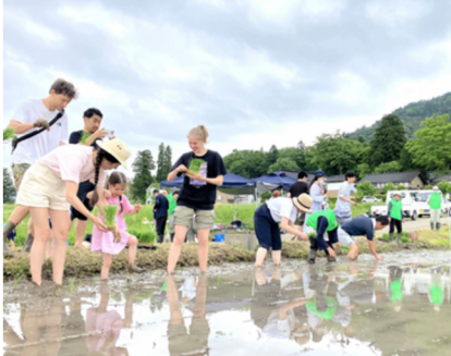
農業体験サービス