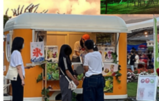
新しいサービスによる販売展開