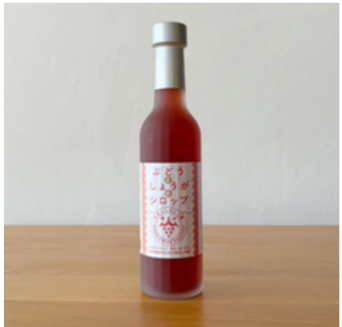
自家農産物の加工品（OEM含む）