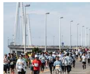
ランナーの様子(新湊大橋)