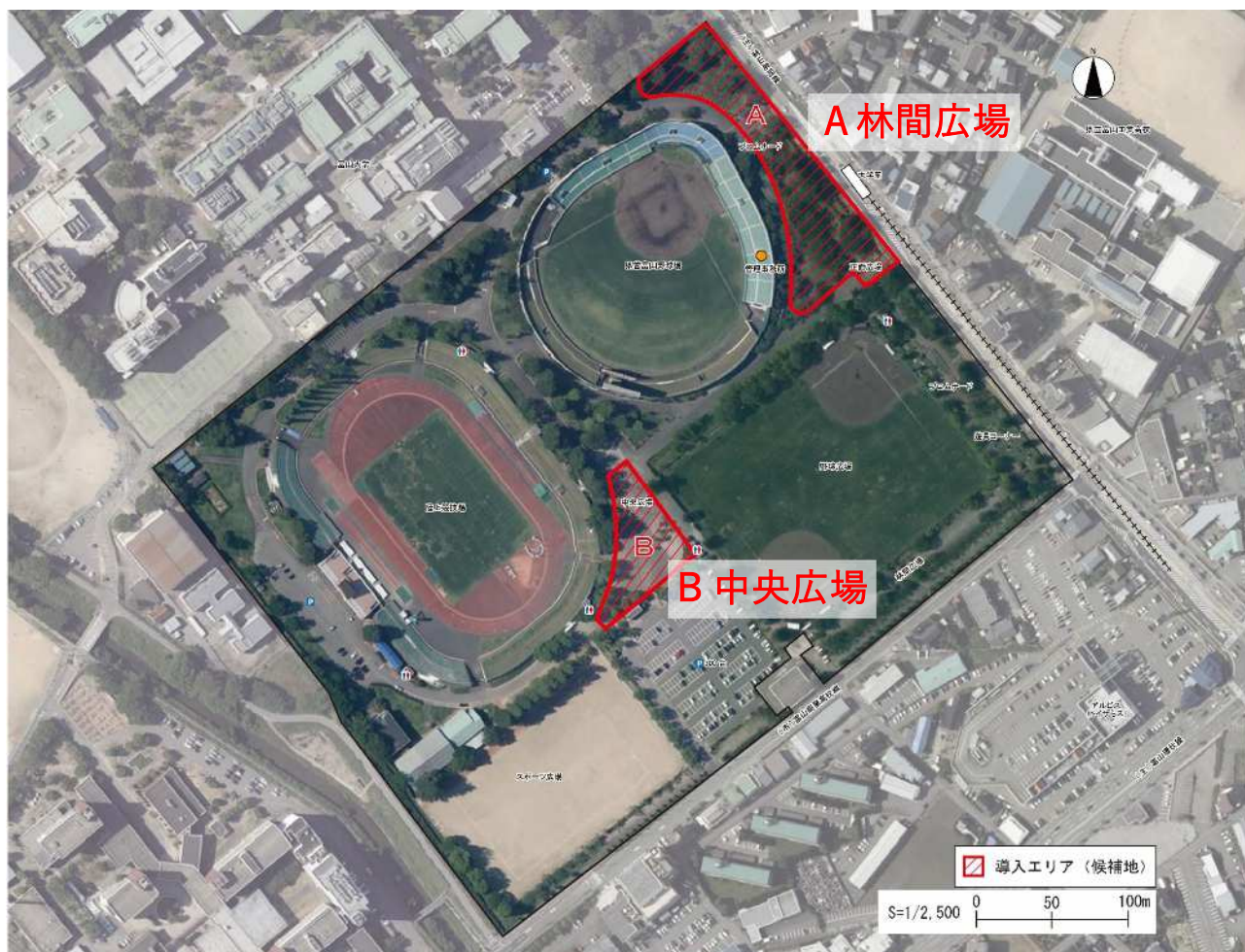
導入エリア(候補地) 五福公園

駐車場に隣接し、本公園の中央に位置しています。広場にはオブジェが設置されています。