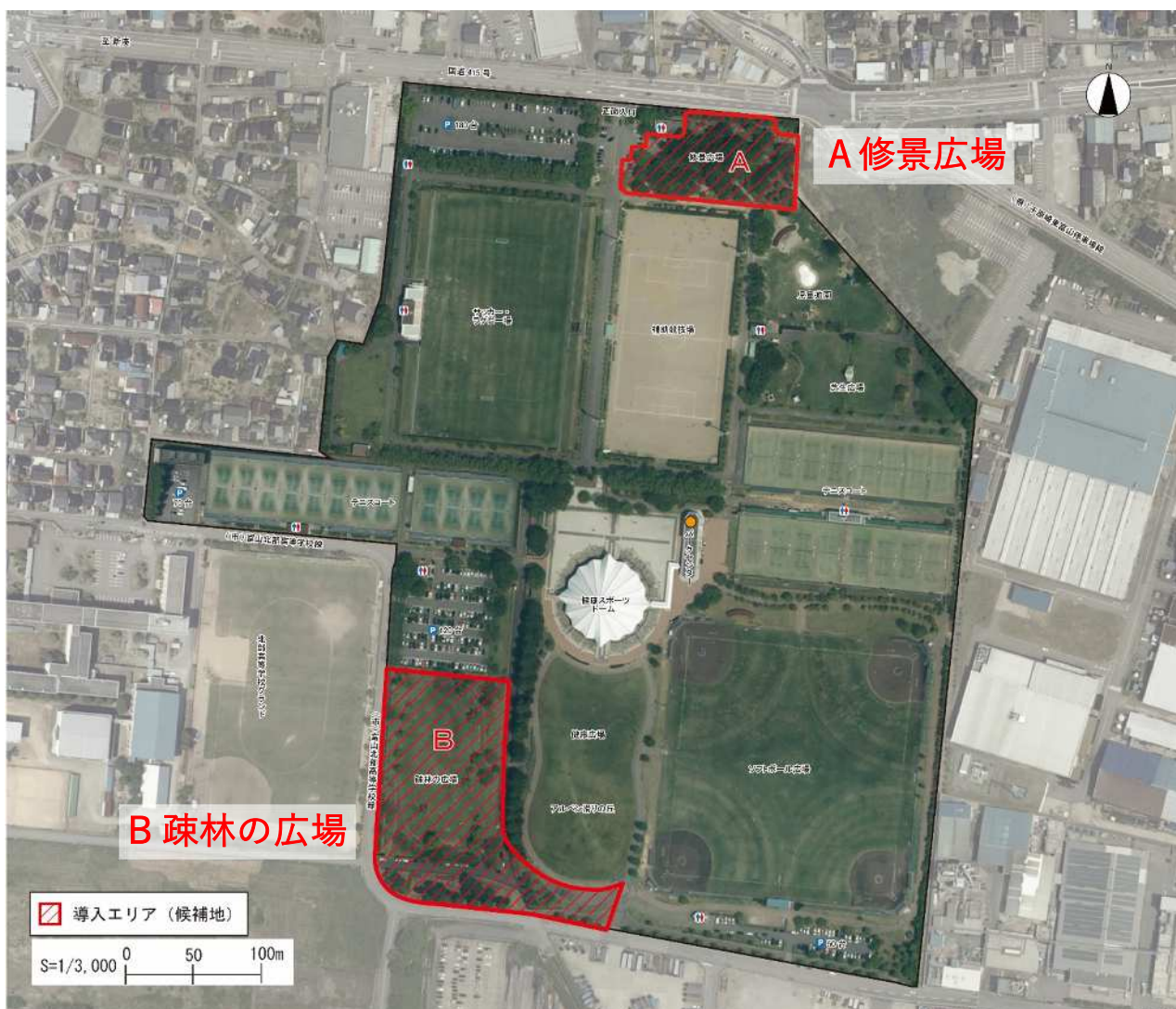
導入エリア(候補地) 岩瀬スポーツ公園