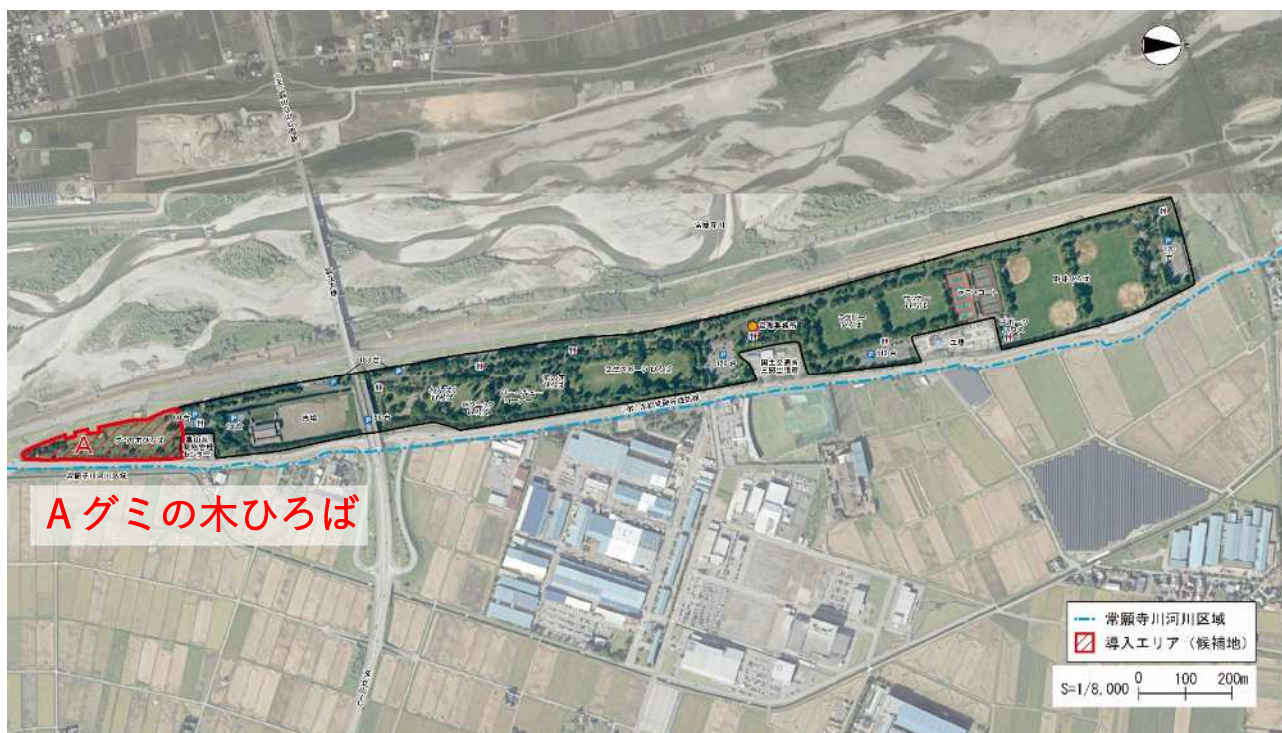
導入エリア(候補地) 常願寺川公園

自由に遊べる広大な芝生広場として整備され、周辺にはグミの木などの植栽が施されていますが、利用者が少なくなっています。