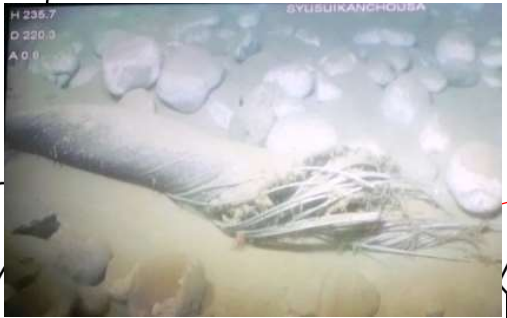
海洋深層水取水管断絶 (入善町)