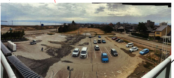
液状化被害（高岡市）