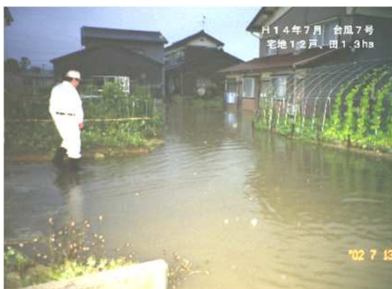
平成 14 年 7 月 仏生寺川