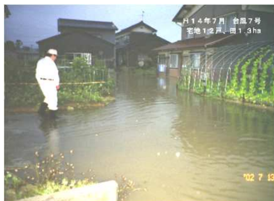
平成 14 年 7 月 仏生寺川