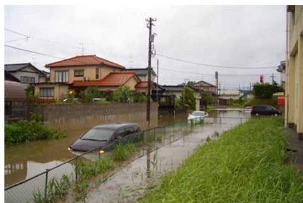
平成 17 年 7 月 上庄川