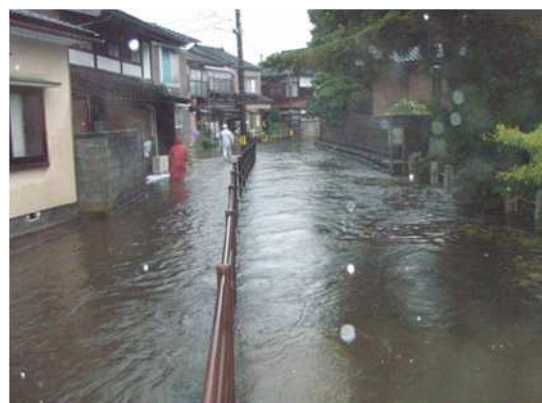
平成 24 年 9 月 沖田川