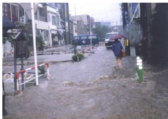
平成 10 年 7 月 鴨川