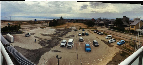
液状化被害（高岡市）