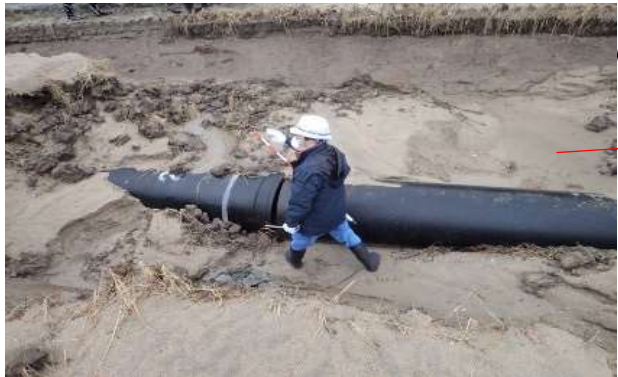
液状化による管水路・農道の被災（氷見市）