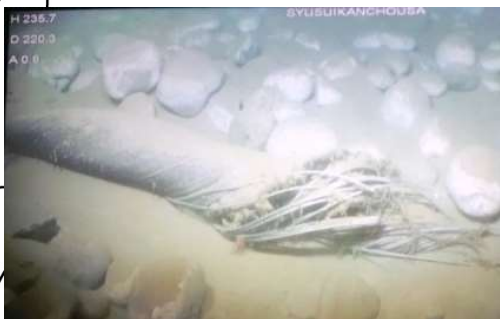
海洋深層水取水断絶（入善町）