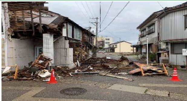
倒壊した家屋（氷見市）